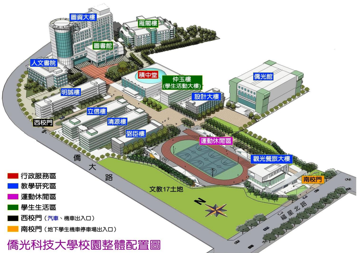
僑光科技大學校園整體配置圖