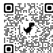
地科入門推廣研習宣傳影片