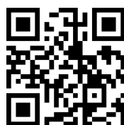
計畫 FB 粉絲專頁