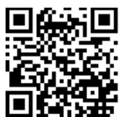
國立臺灣師範大學 科學教育中心

所有參加研習之學生需經家長或監護人同意始可報名，獲錄取者於報到時須繳交家長或監護人同意書。獲錄取者請至科學教育中心網站 http://www.sec.ntnu.edu.tw/ 下載空白表單。