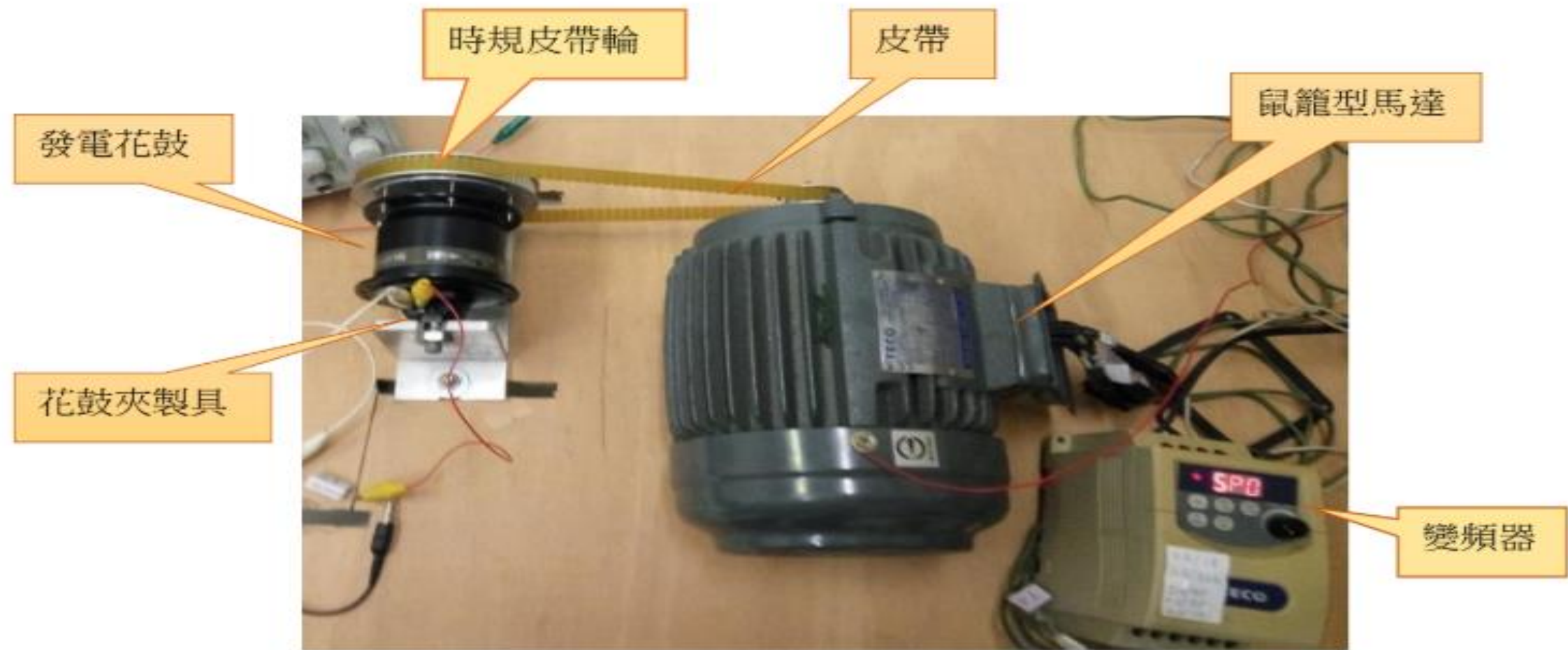
花鼓與驅動設備頂視圖