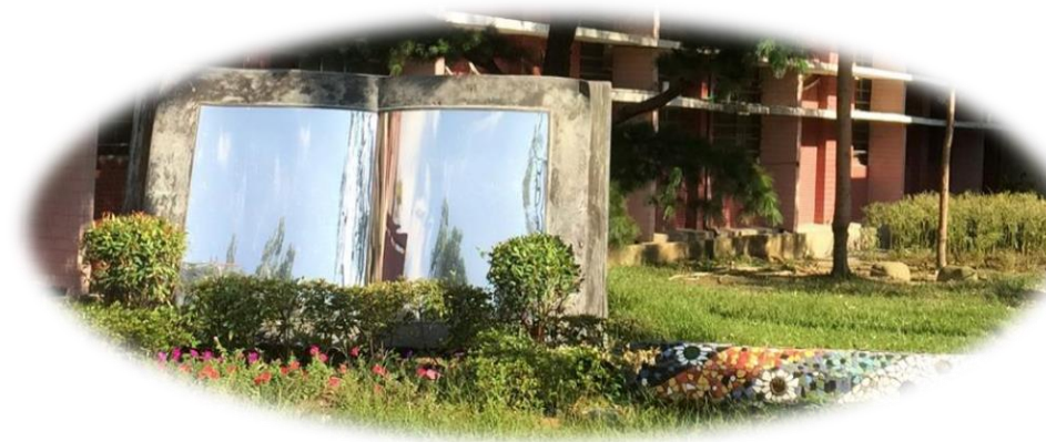
臺中市西苑高級中學學生自主學習計畫期末自我檢核表